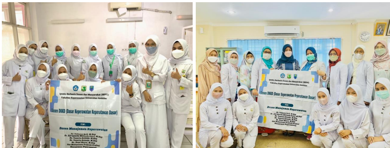
Gambar 2. Tim Kegiatan Pengabdian kepada Masyarakat dan Perawat